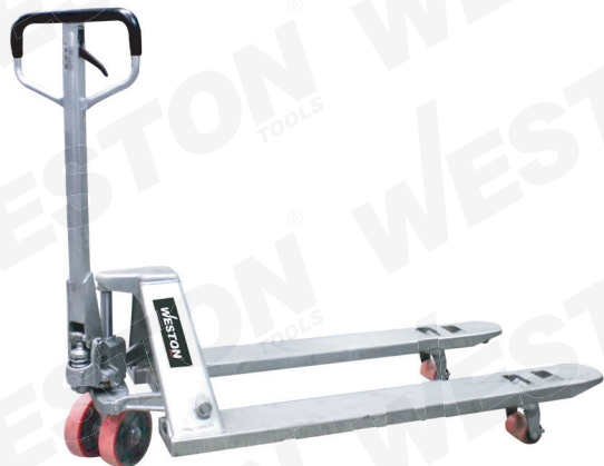
Y-9099-PATG Acabado galvanizado