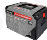
Maletín de plástico