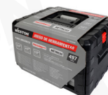
Maletín de plástico