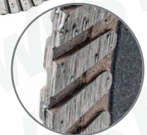
Banda de diamante