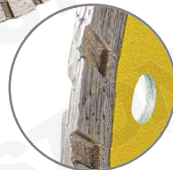
Banda de diamante