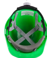
Ajuste con matraca